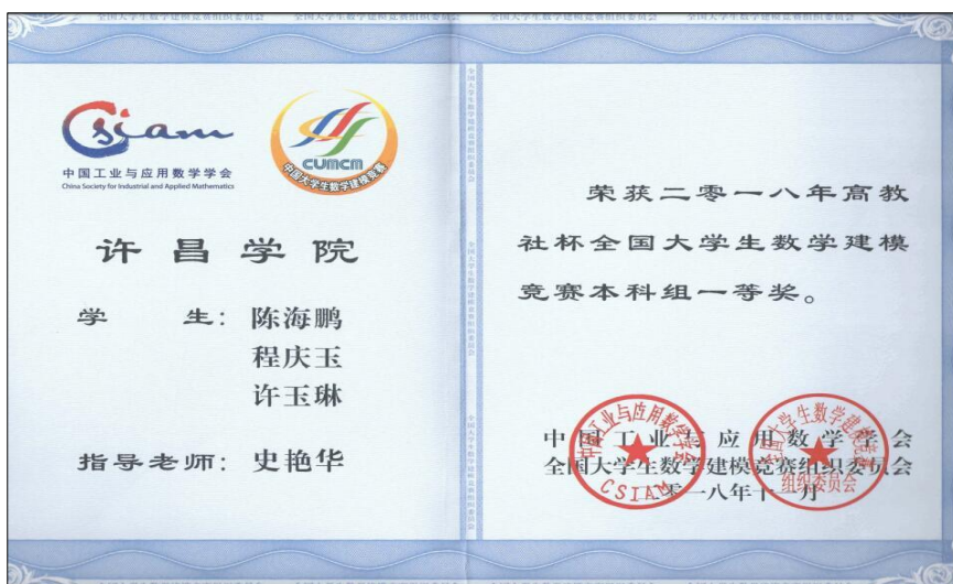
图 1 我校获“2018 年全国大学生数学建模竞赛”国家一等奖

学校将强化学生实践能力及职业能力作为教学改革的重点。一是建立和完善产教融合、协同育人的人才培养模式；二是遵循“成果导向”理念，重构课程体系，强化应用型课程；三是强化创新创业教育和训练；四是利用第二课堂提升学生职业能力。2018-2019 学年，学生在全国大学生数学建模竞赛、“挑战杯”大学生课外学术科技作品竞赛、师范毕业生教学技能大赛等比赛中获得省部级以上奖励共计 609 项：国家级奖励 223 项，省部级奖励 386 项。其中，在“2018 年全国大学生数学建模竞赛”中，我校获得国家一等奖 1 队，实现了我校在此项赛事中国家一等奖的历史性突破。在各类文艺、体育竞赛中获得省级以上奖励 306 项，其中，国家级奖项 108 项，省级奖项 198 项。